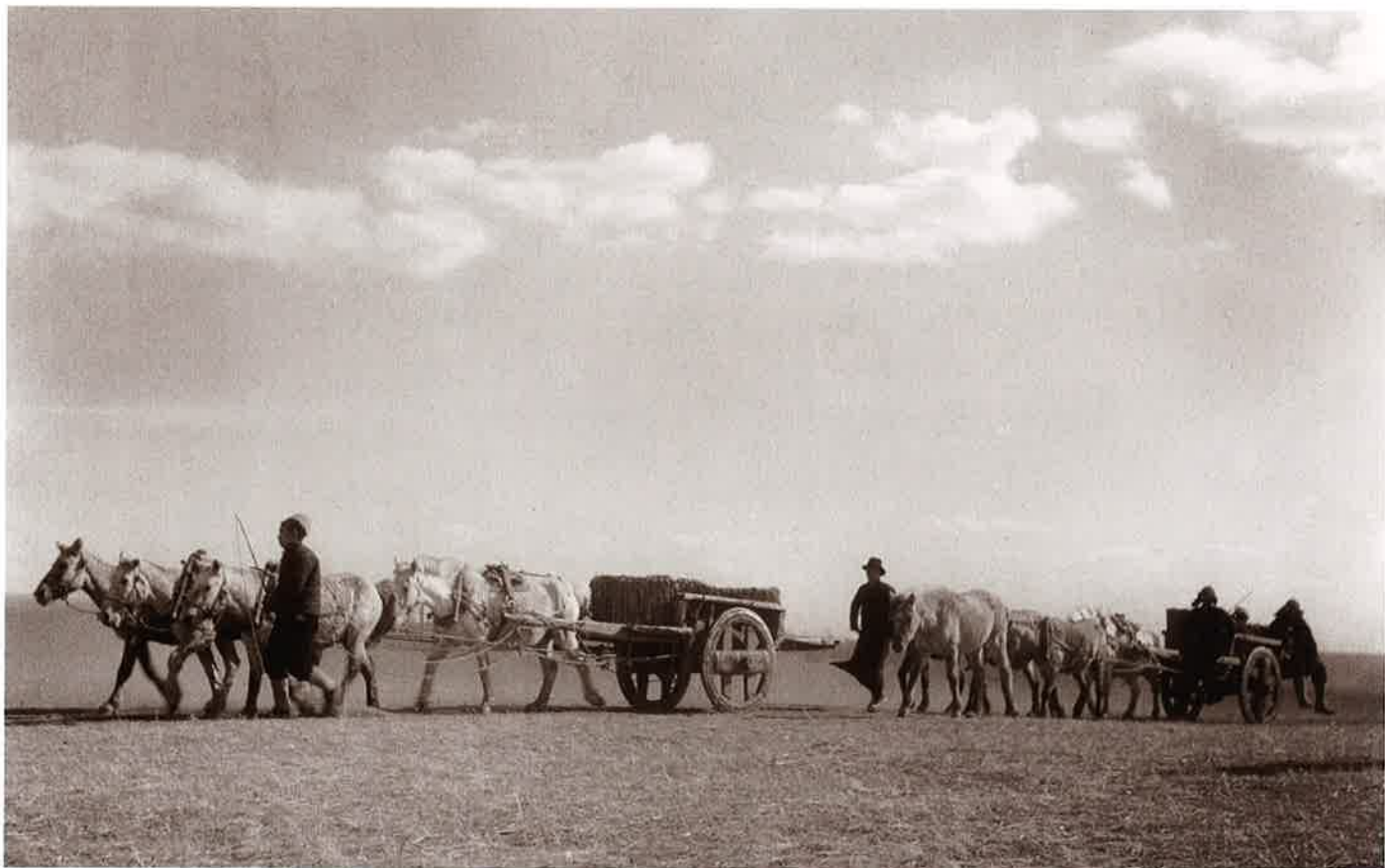
10 草原を行く(1) 王府(科爾沁)(Khorchin) 写真月報(昭14.8)