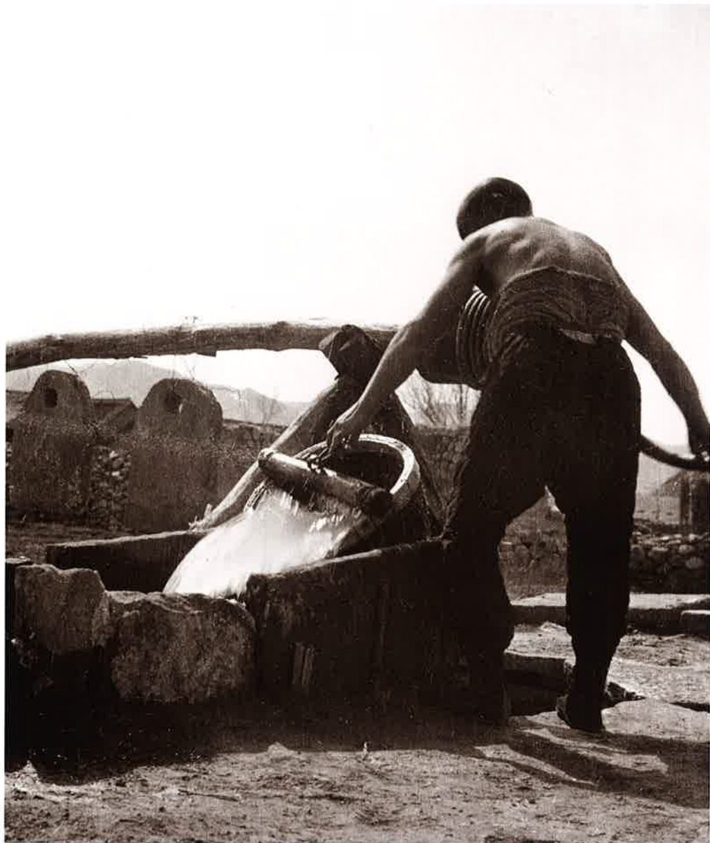
8 水を汲む 承德 (Chengteh) カメラ報告大陸(昭14.12)