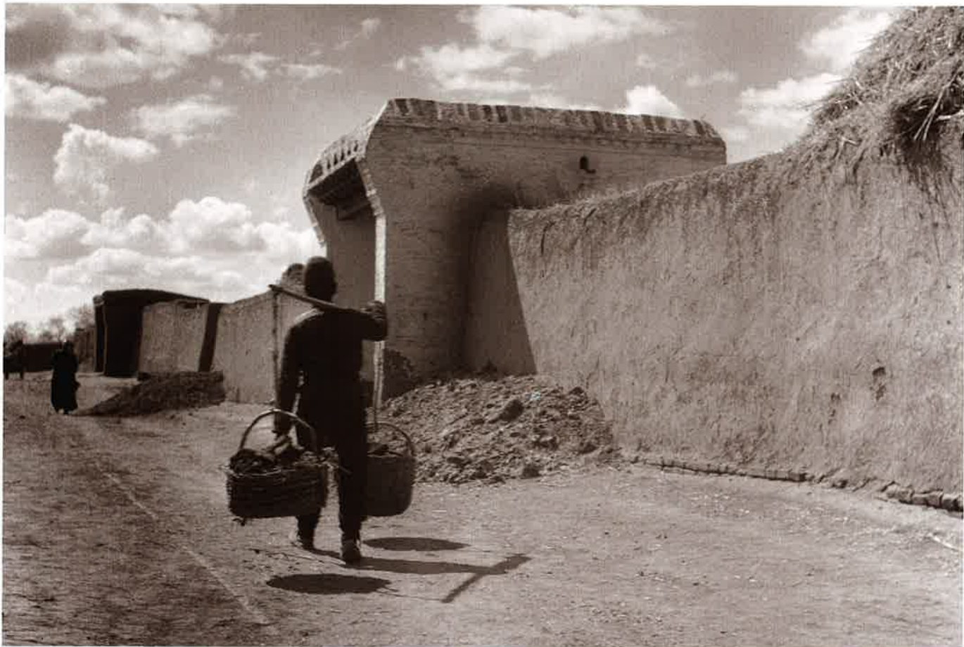
9 土の街 承德 (Chengteh)