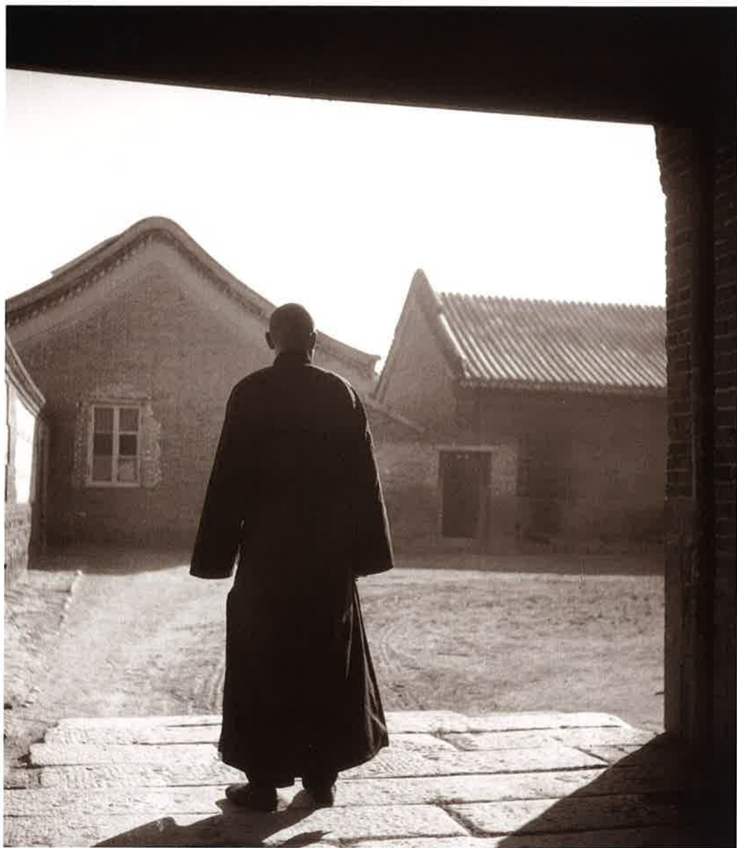
7 内庭にて 承德(Chengteh) 写真サロン(昭14.8)