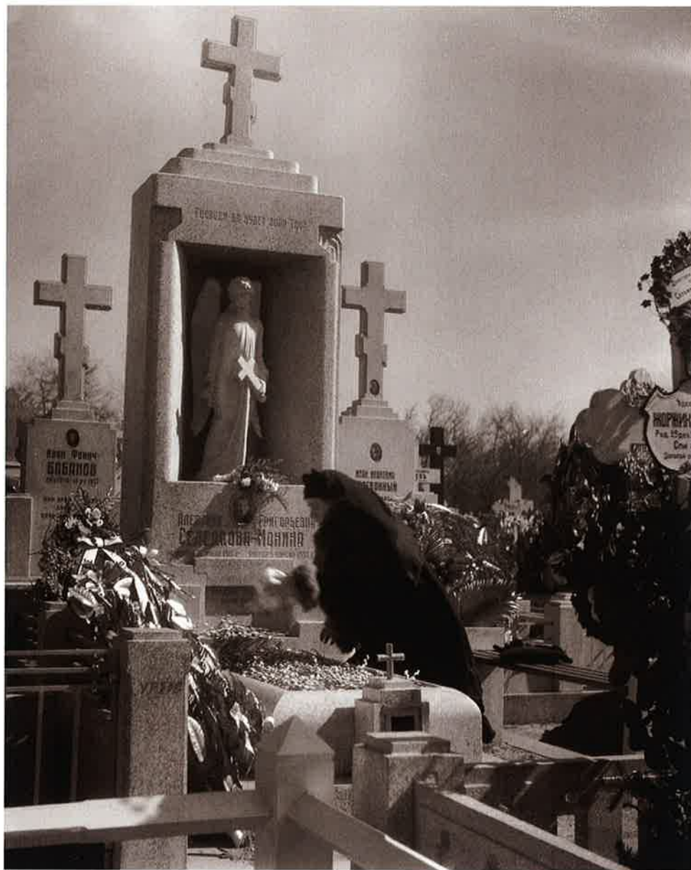
14 墓参 哈爾濱(Harbin)