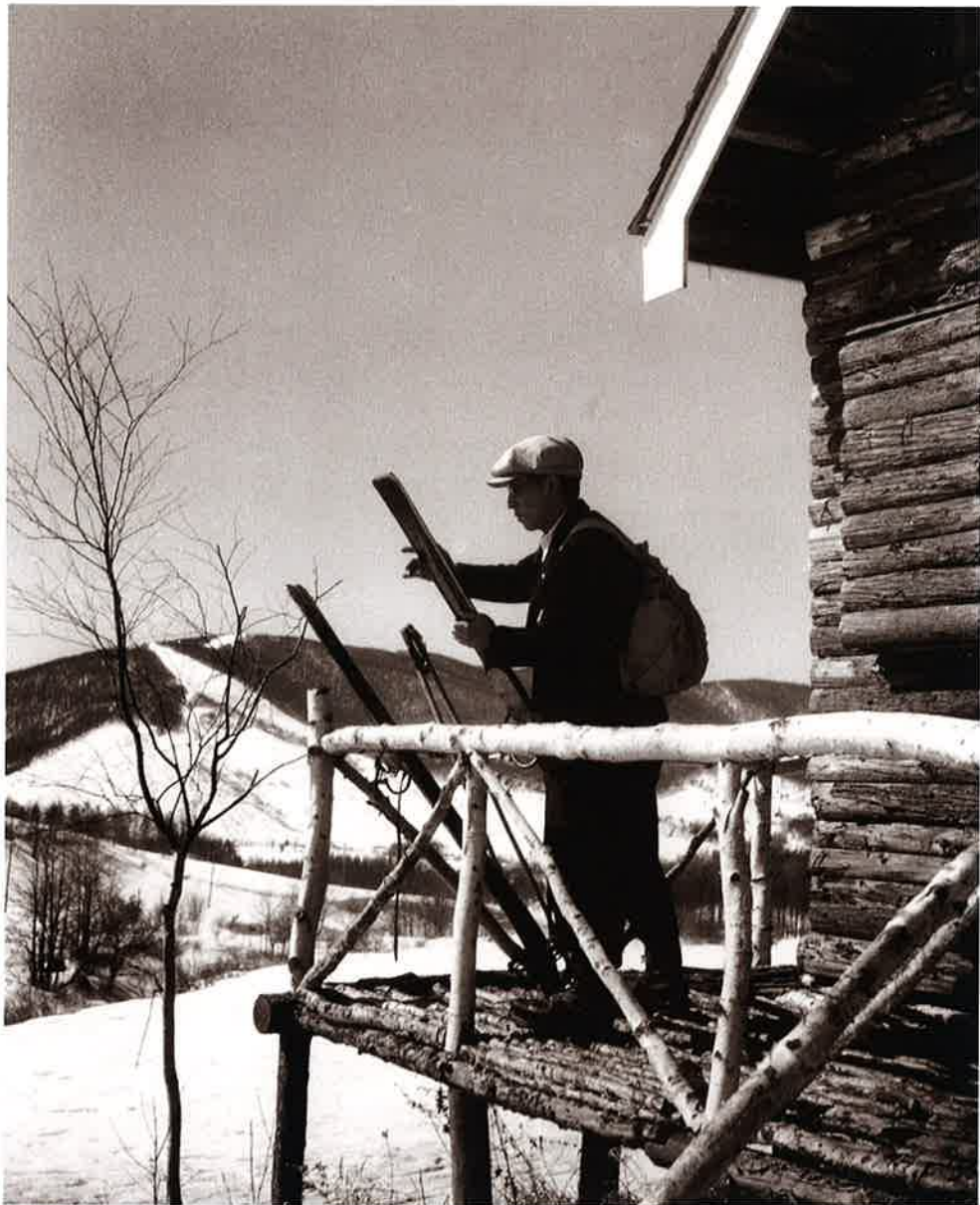
32 ヒュッテにて (菅平)