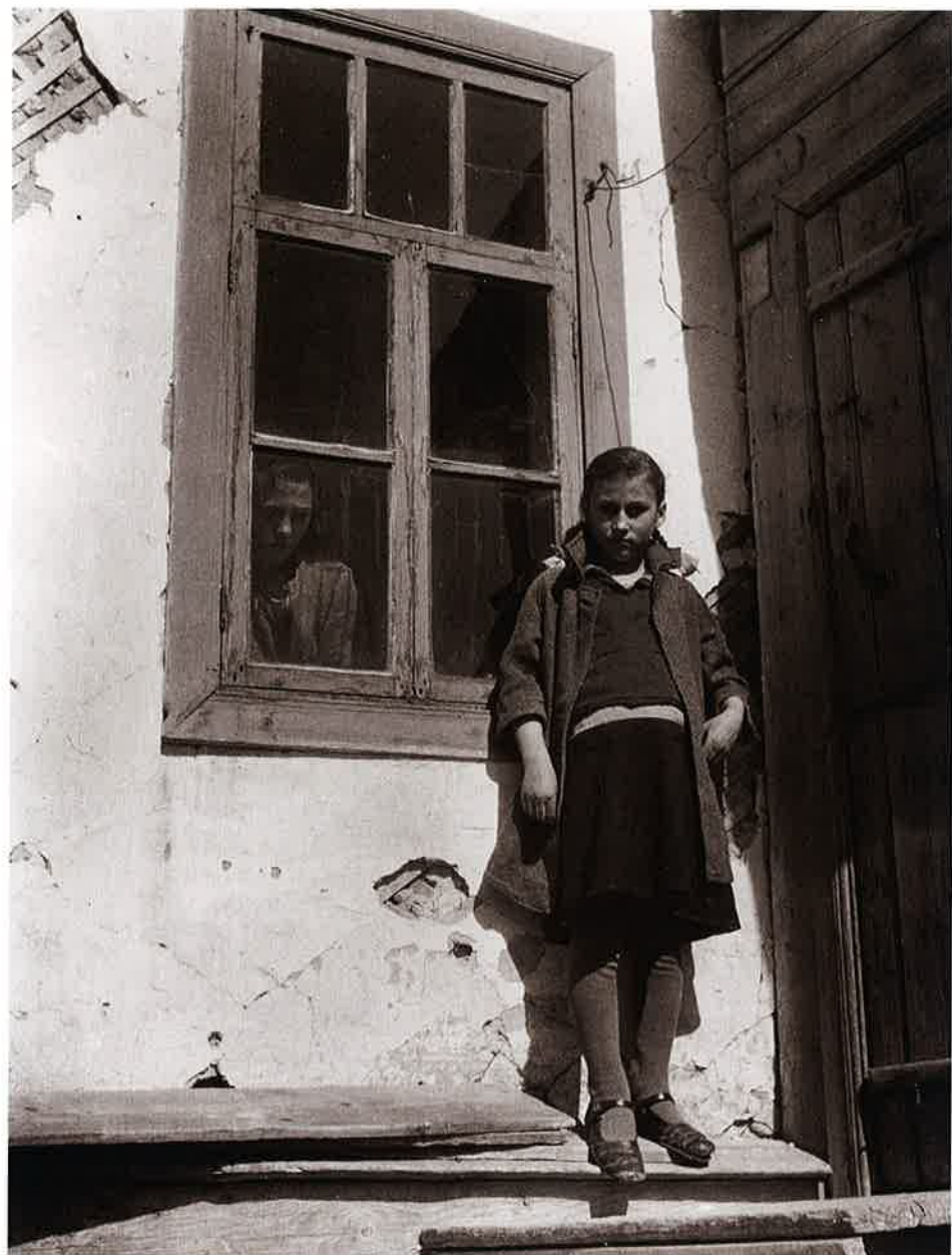
18 貧しい白ロシアの母子 哈爾濱 (Harbin)