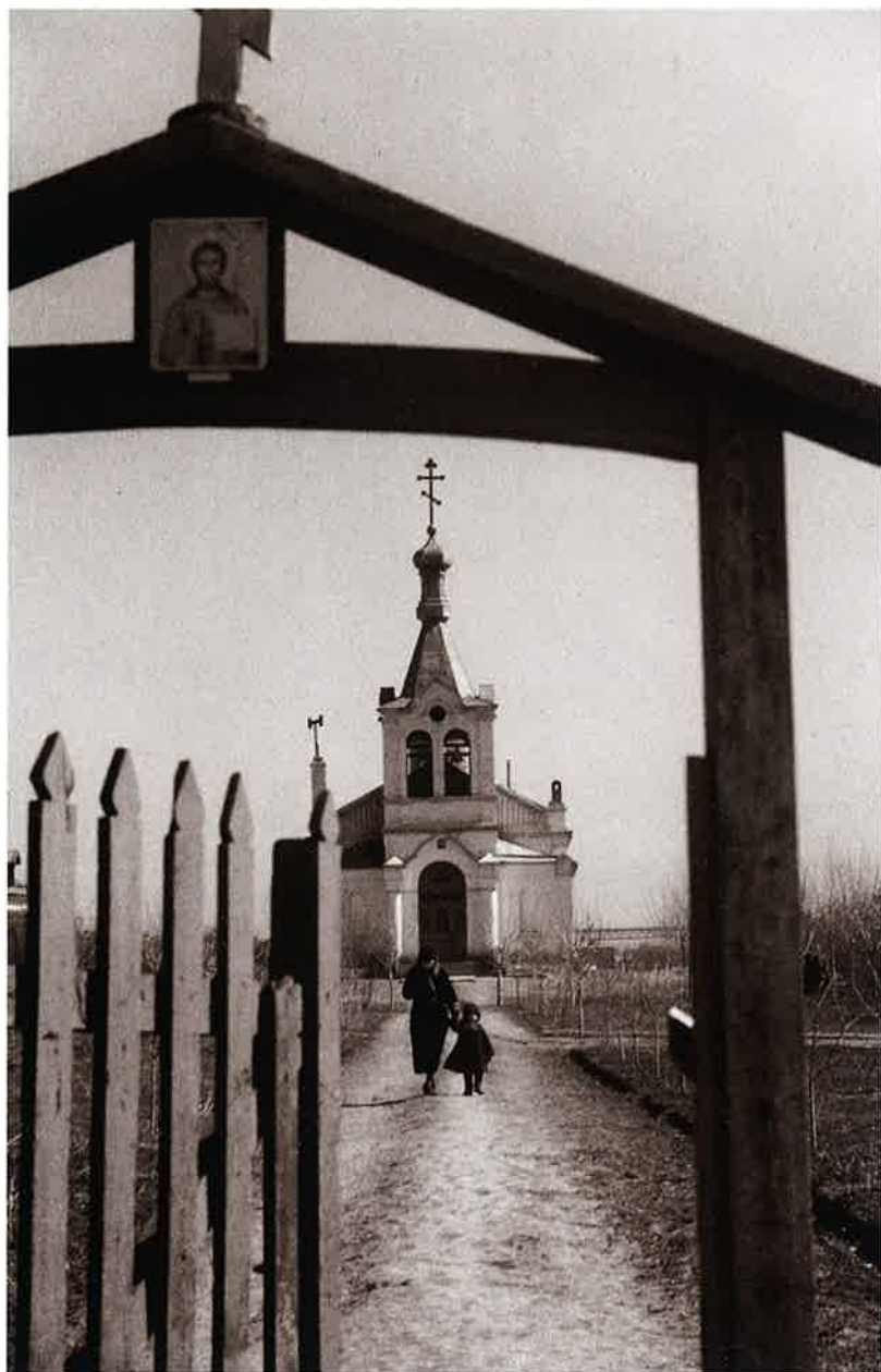
17 礼拝のあと 哈爾濱(Harbin) 写真月報(昭15.6)