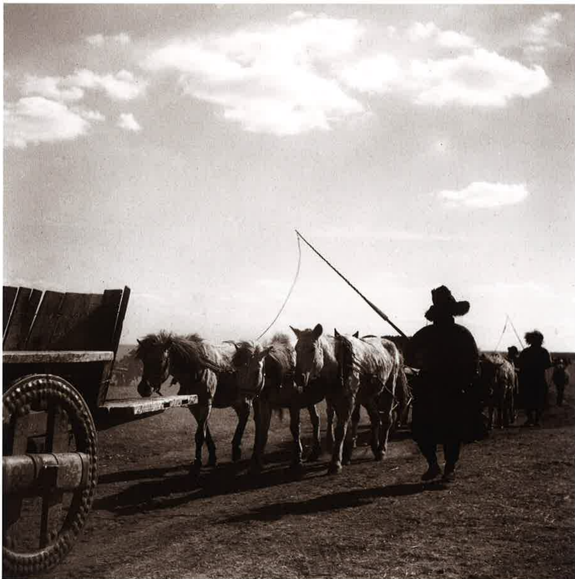
11 草原を行く(2) 王府(科爾沁)(Khorchin) ギャラリー(昭14.8)