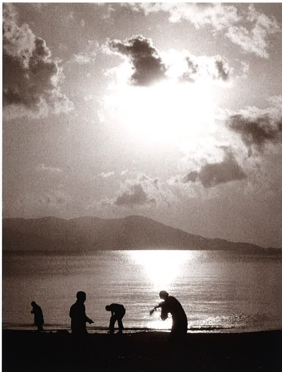
30 夕風(1) (沼津)