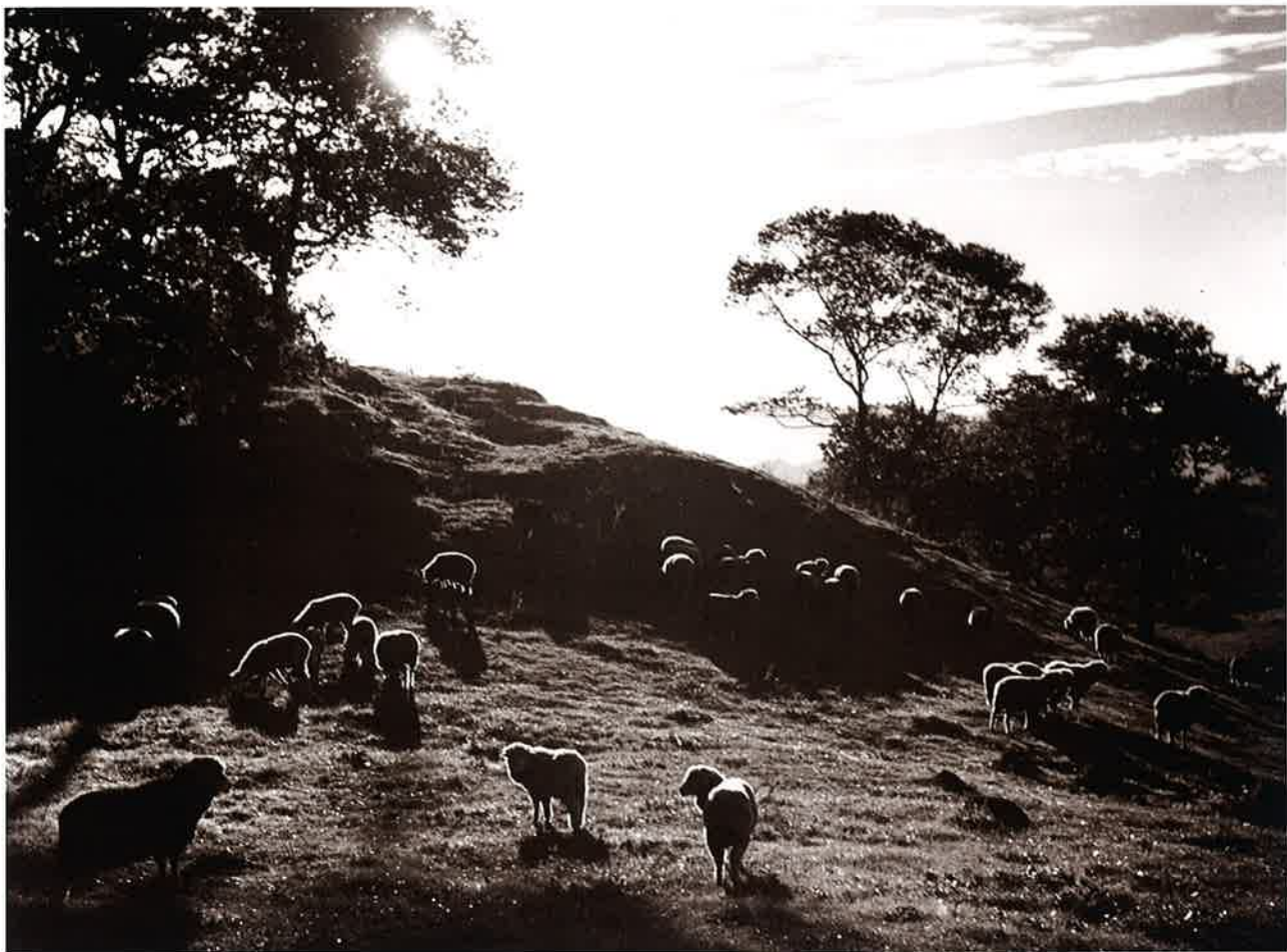
28 牧場の朝(1) (神津牧場) 朝日カメラ(昭15.1)