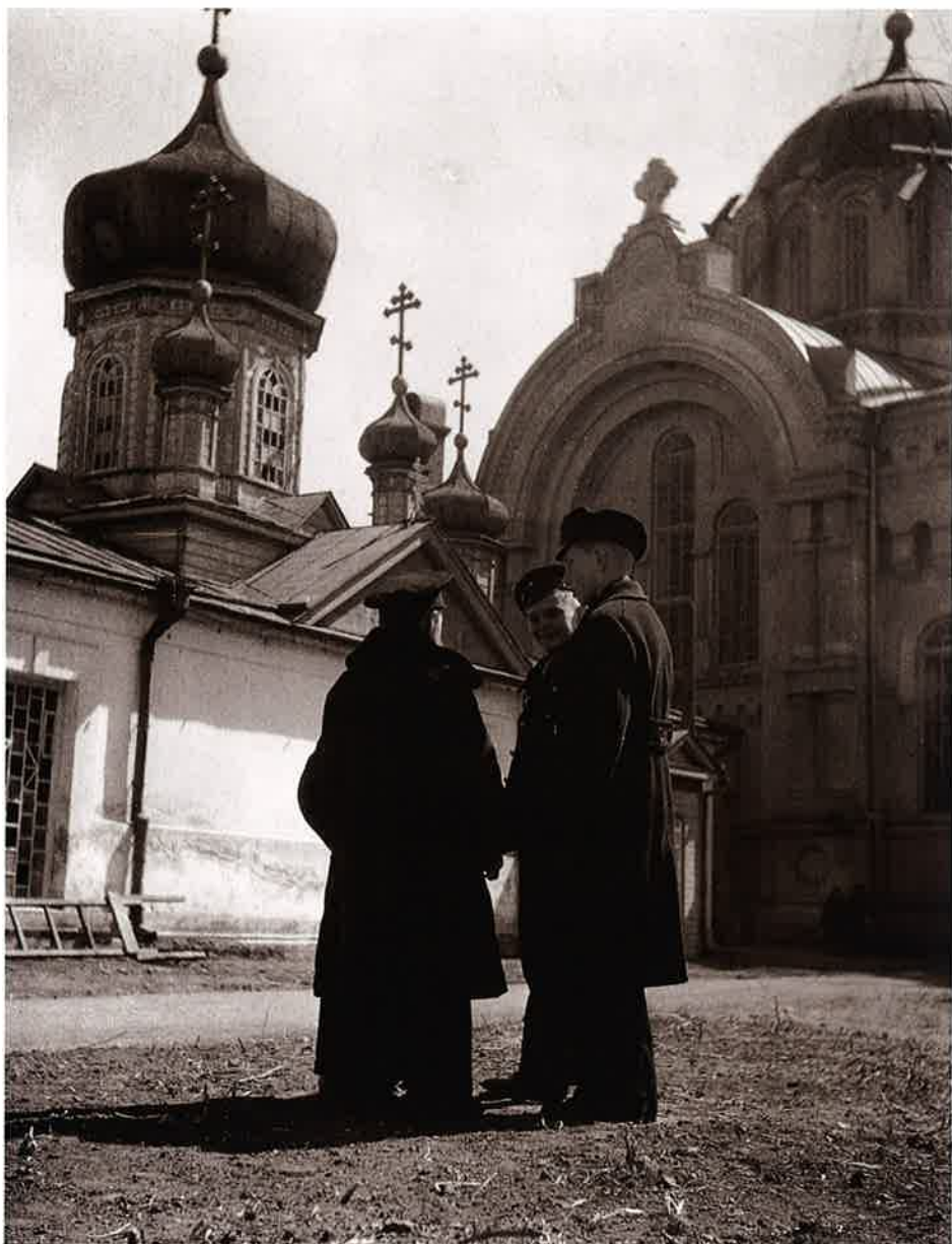
16 白ロシアの少年 哈爾濱(Harbin)