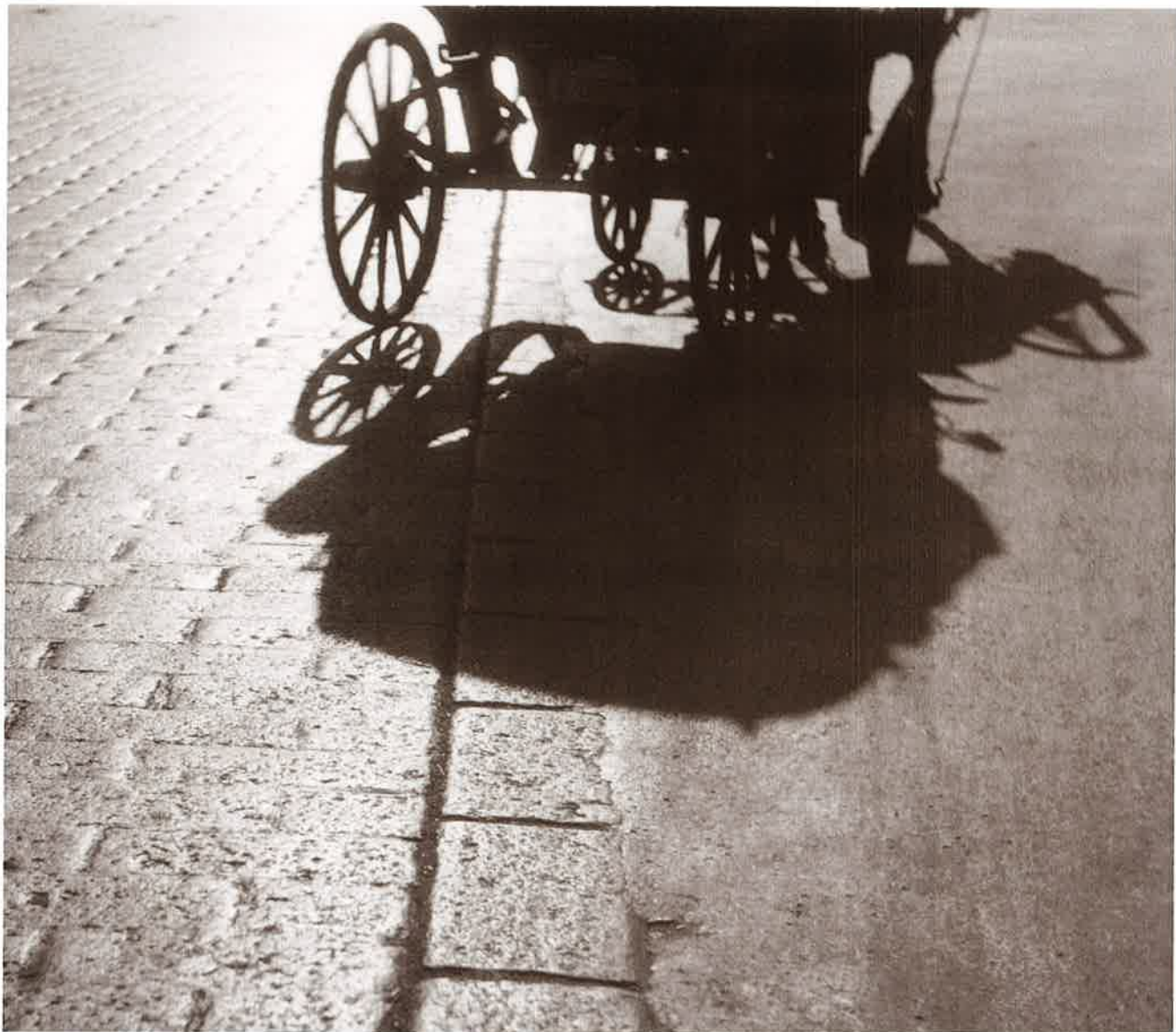
2 蹄の音 新京(長春)(Changchung) 写真月報(昭14.8)