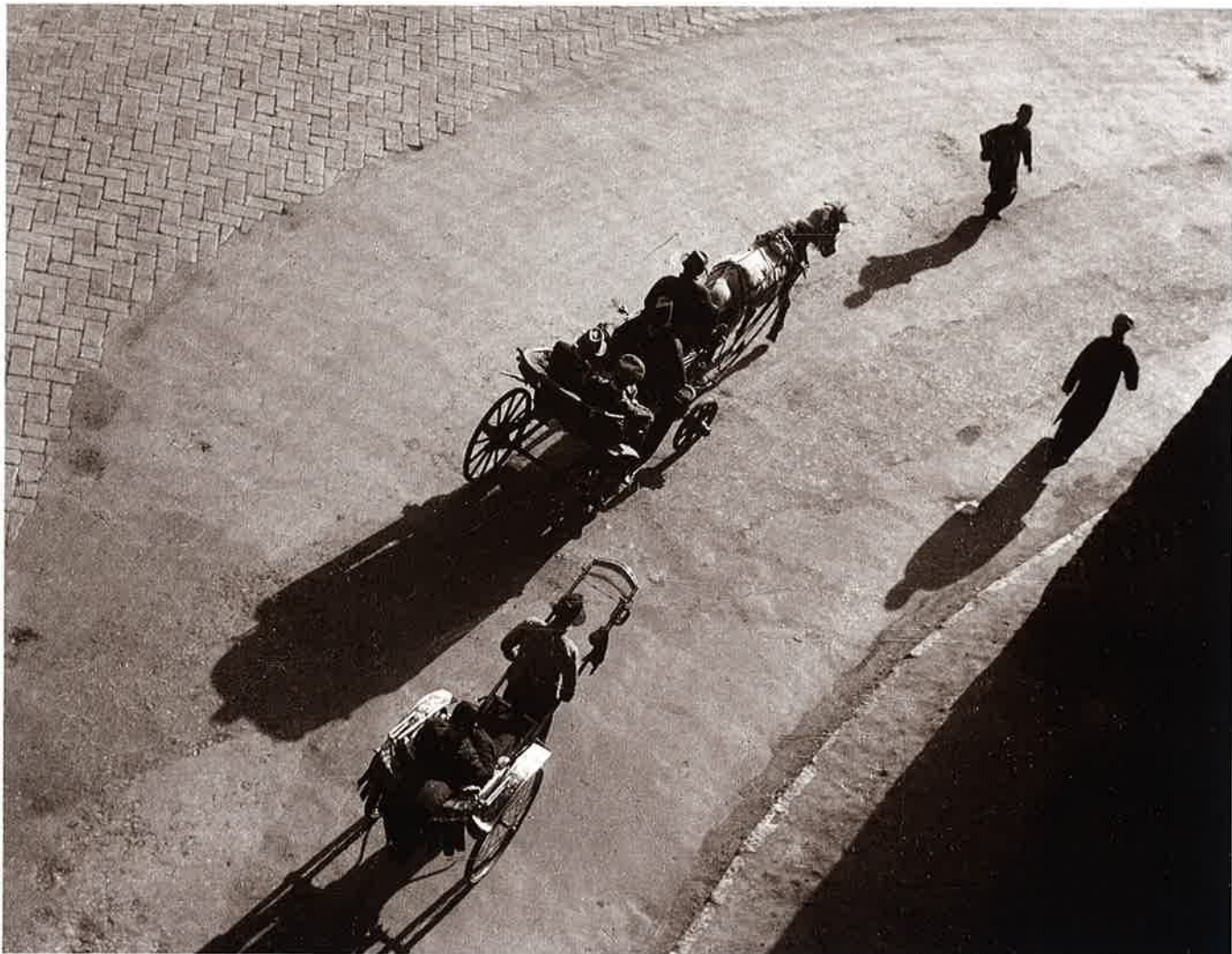
4 静かな街 大連(Talien)