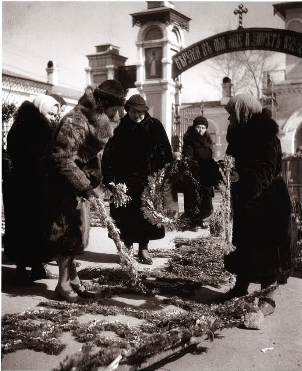
13 花を買う婦人 哈爾濱(Harbin)