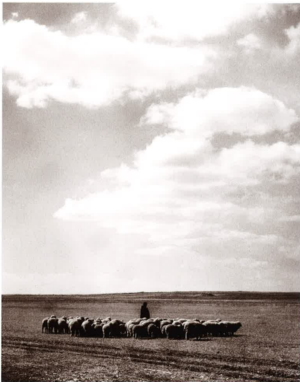
12 曠野に羊を飼う 王府(科爾)(Khorchin)