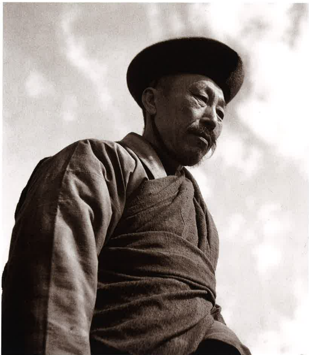
6 蒙古僧 王府(科爾沁)(Khorchin)