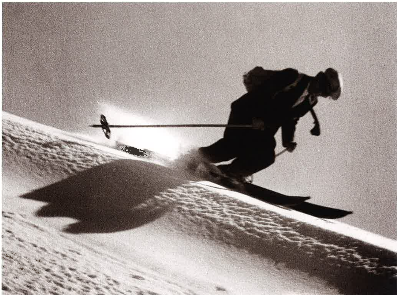
33 クリスチャニア (菅平)