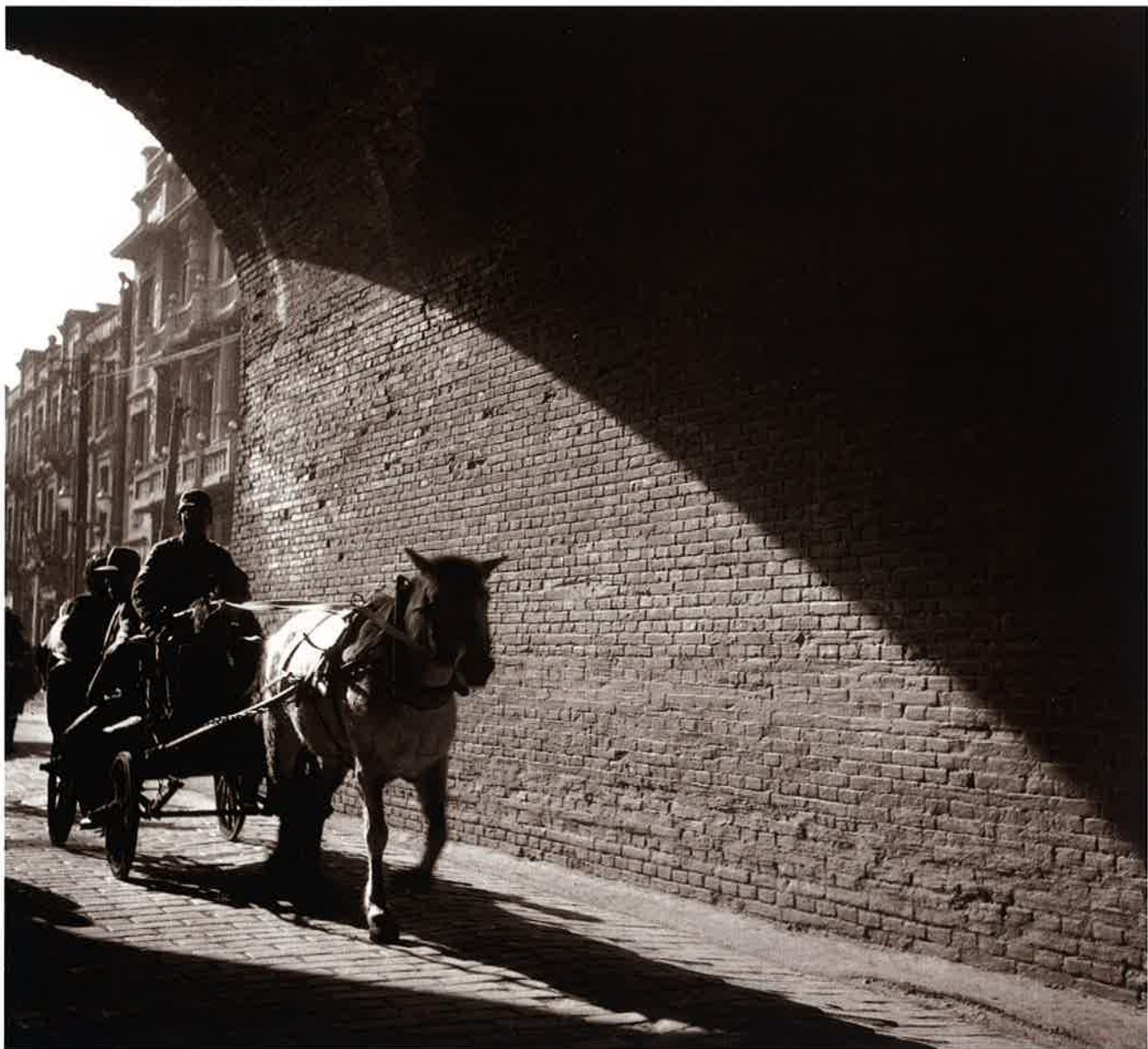
3 斜陽 新京(長春)(Changchung)