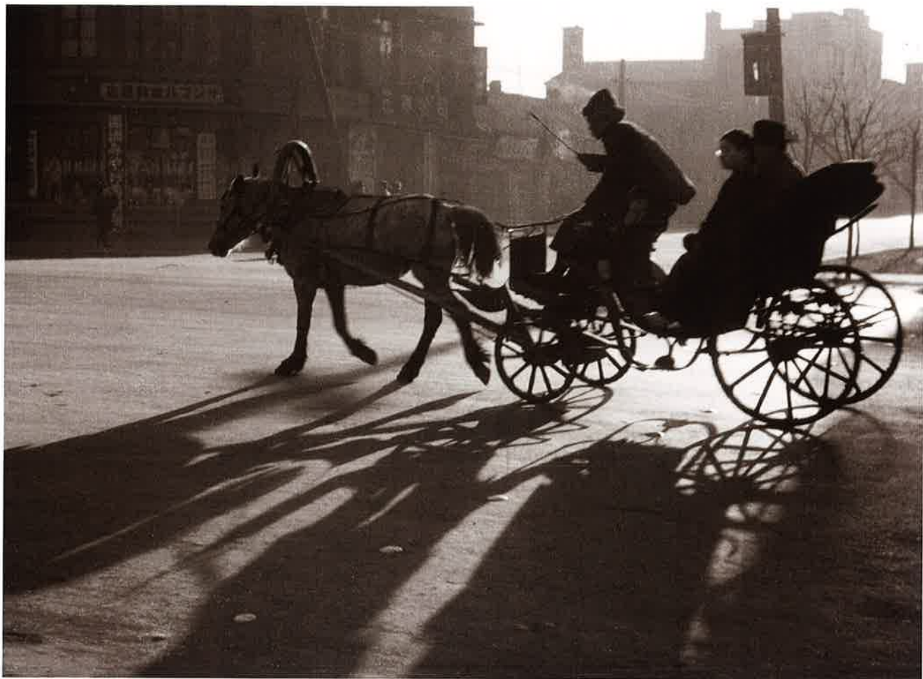
1 馬車の行く街 新京(長春)(Changchung) アマチュアカメラNo93(昭14.8)