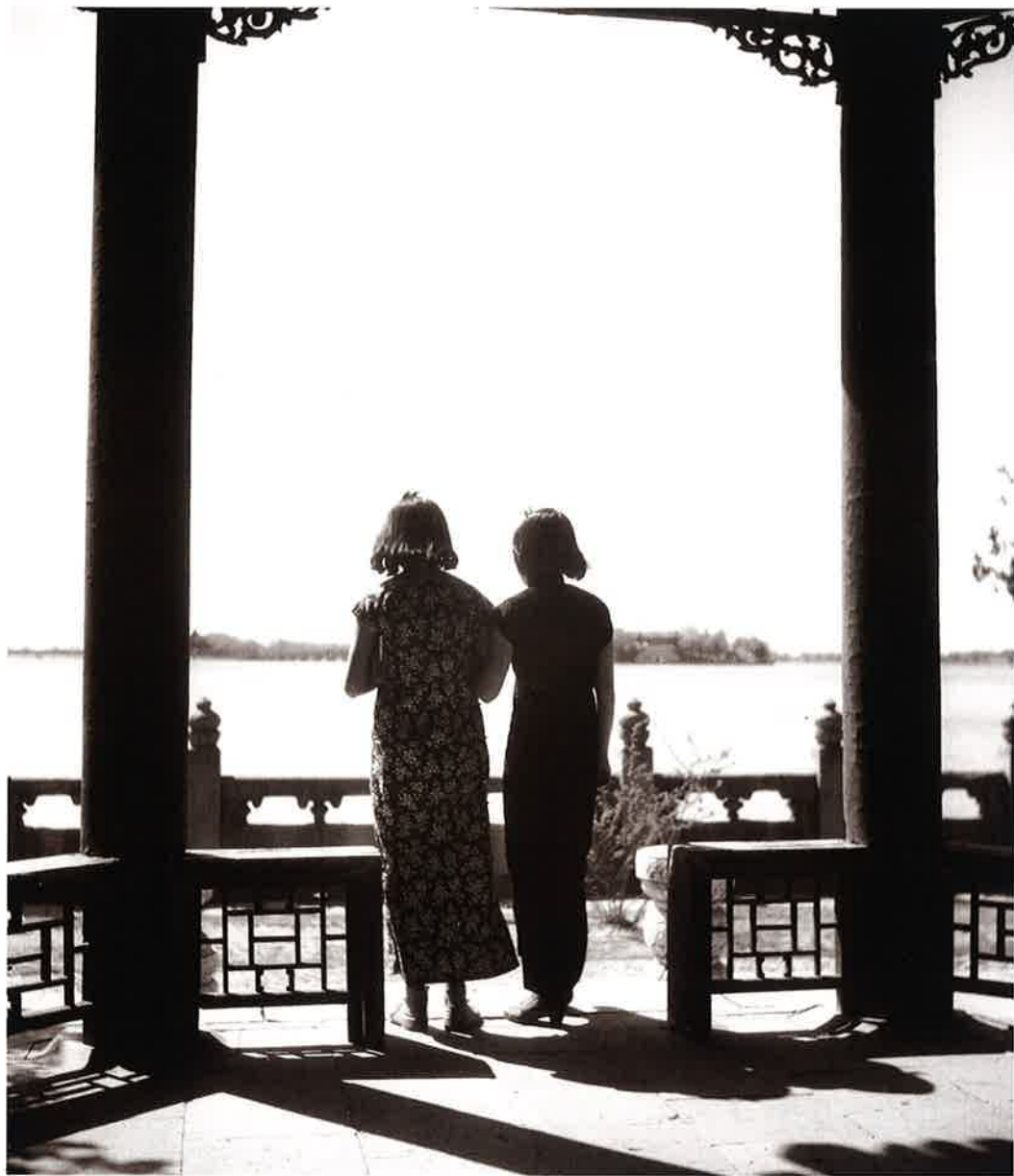
20 北海公園 北京(Beijing)