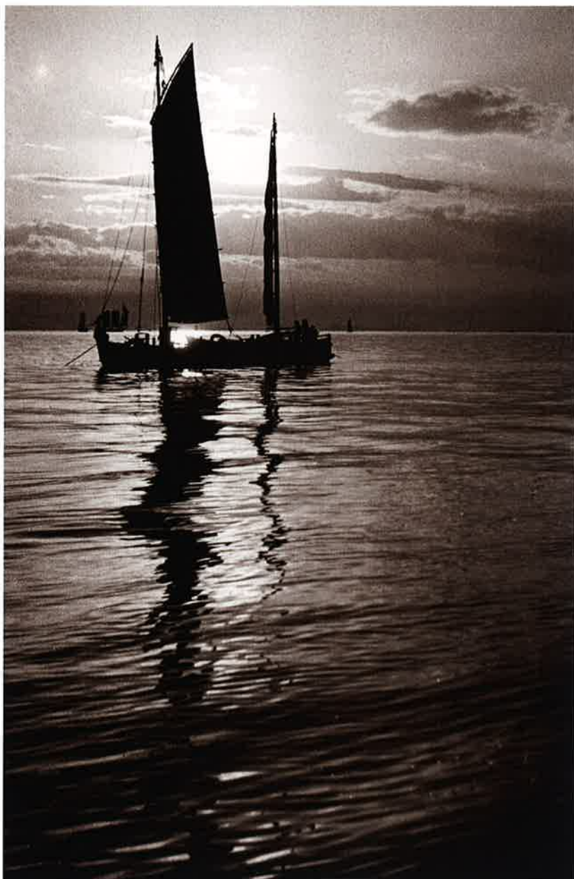
31 夕凧(2) (須磨) アマチュアカメラ(昭14.5)