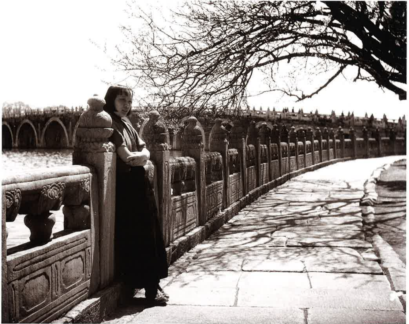
19 昆明湖にて 北京(Beijing)