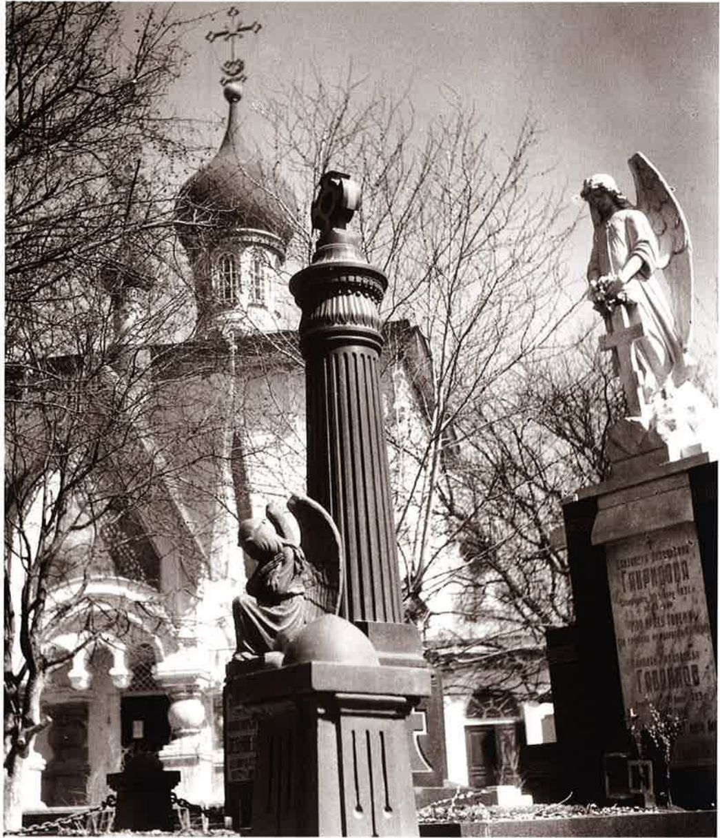
15 教会の墓地 哈爾濱 (Harbin) カメラ報告大陸(昭14.12)