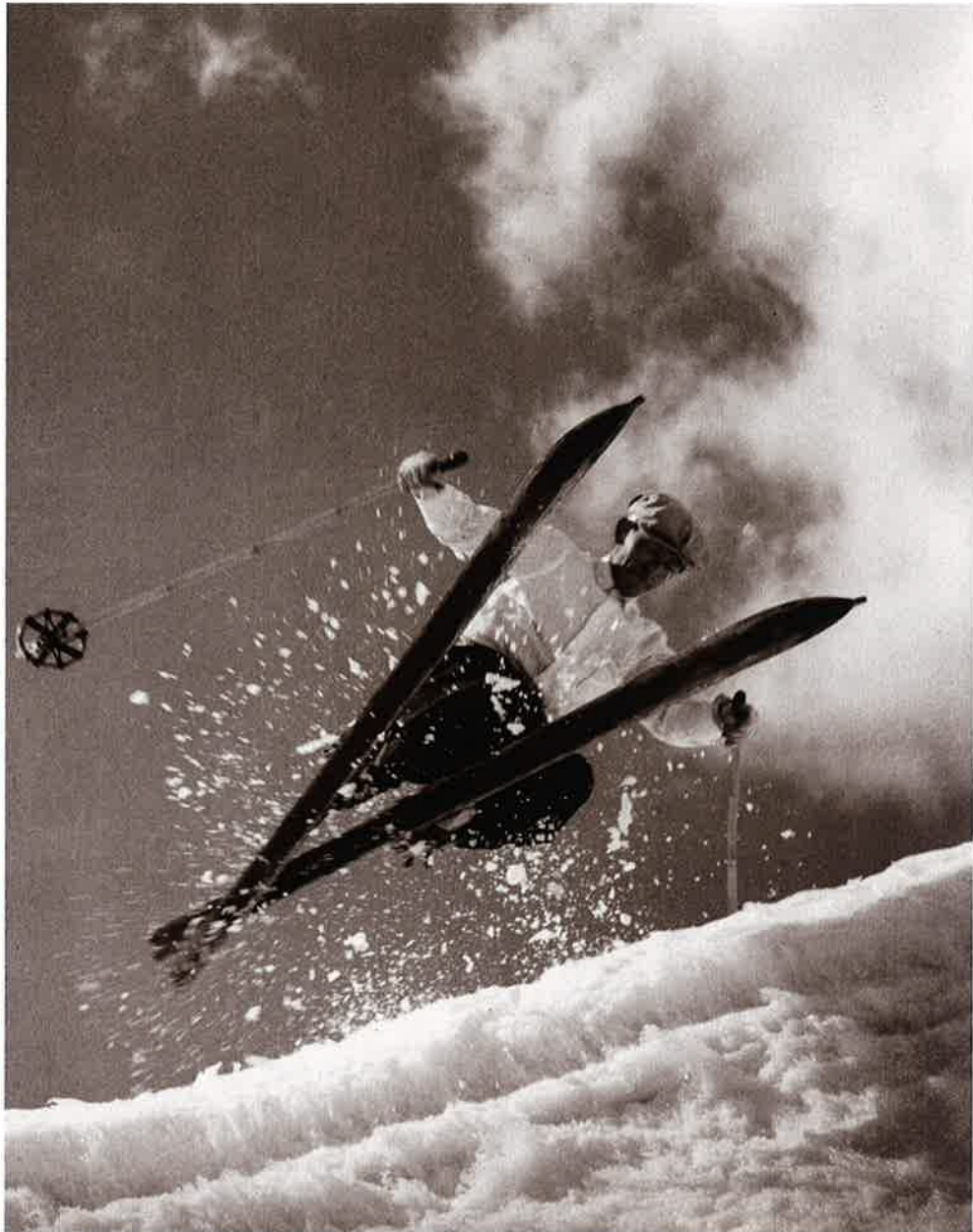
34 ジャンプターン (菅平)