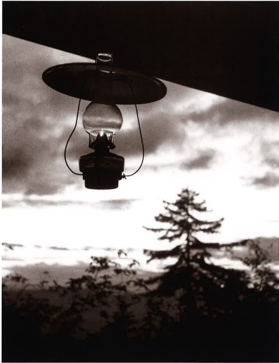
35 秋の夕暮れ (定山溪)