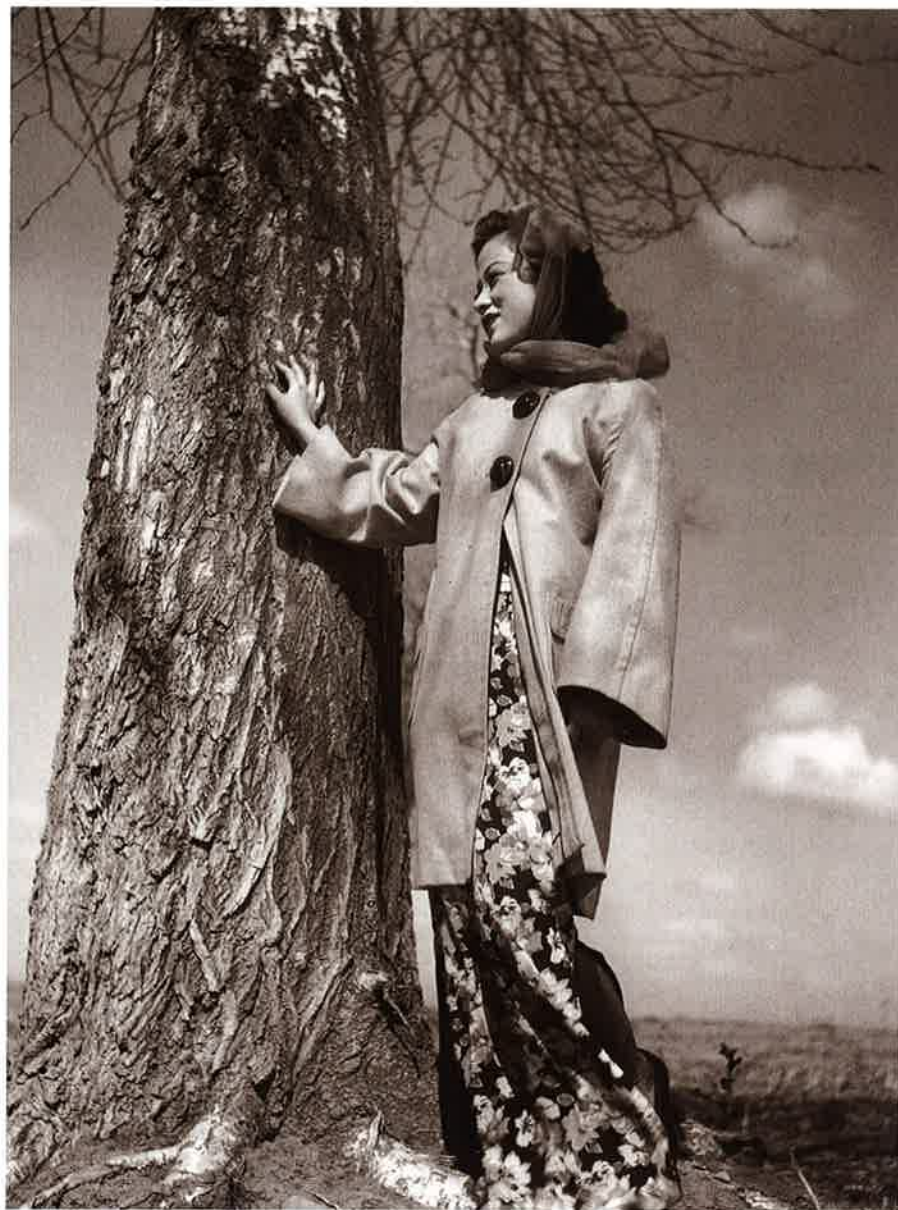
5 李香蘭 新京(長春)(Changchung) カメラ報告大陸(昭14.12)